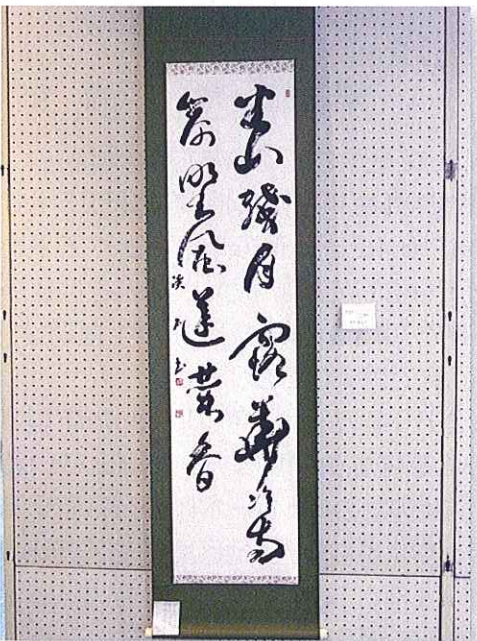
第3地区 榎 七 千