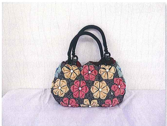
第2地区 堂 下 ヲウ