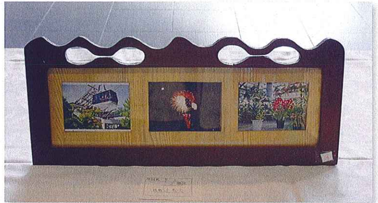
第2地区 辻 和夫