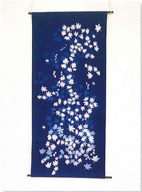
「もみじ」 第4地区 栗津 勉