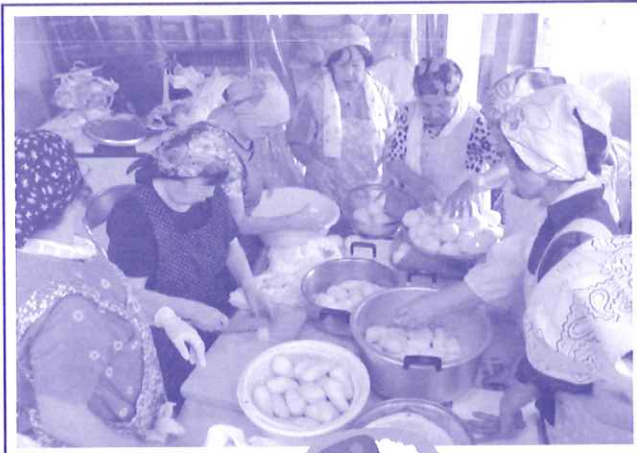
カレー仕込み準備中