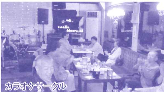
カラオケサークル

集まるのは、月2回月曜日となっておりますが月火となったり、月4になったりしています。話し合いで決め、連絡網を利用しています。笑いの絶えない楽しい会ですので顔を出して見たいと思われる方がいましたら、お待ちしております。