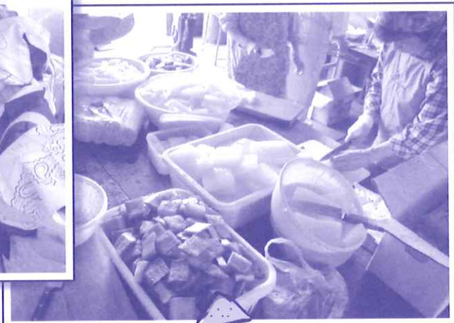
おでん仕込み準備中