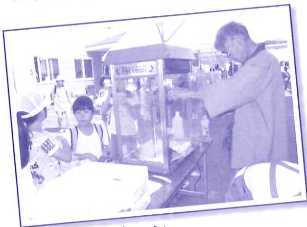
縁日広場・ポップコーン