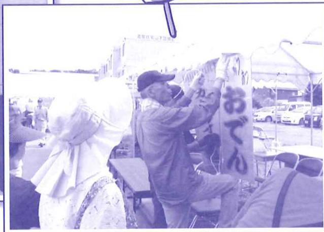
おでんブースの準備作業