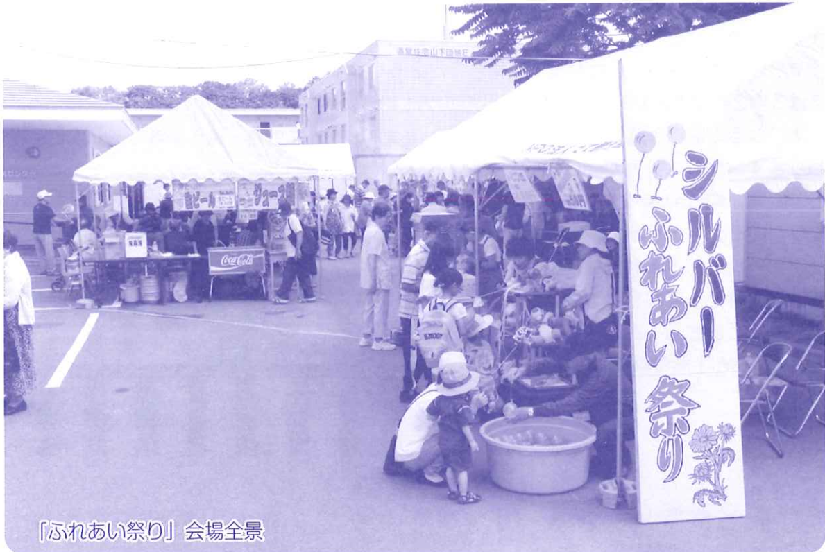
「ふれあい祭り」会場全景