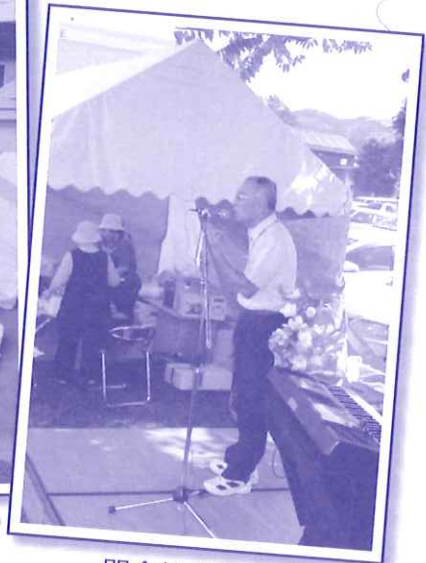
開会挨拶をする理事長