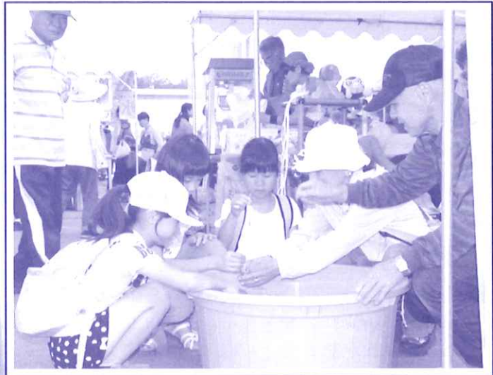
縁日広場・ヨーヨー釣り