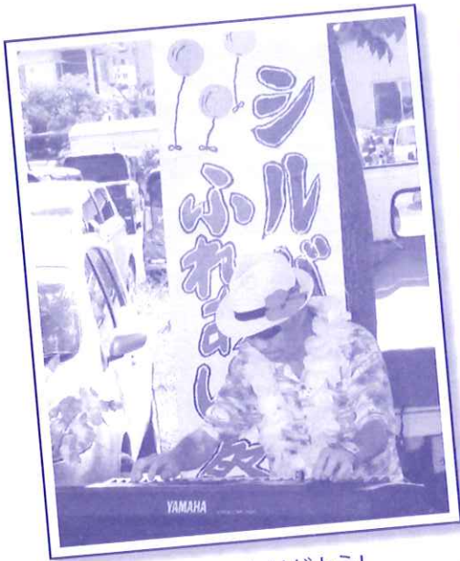
吉田会員!今年もありがとう!