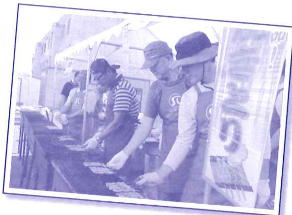
やきとりコーナー