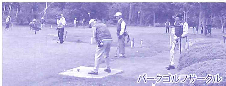
パークゴルフサークル