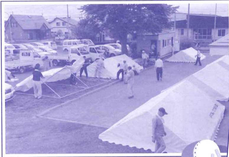
テント設営の準備作業