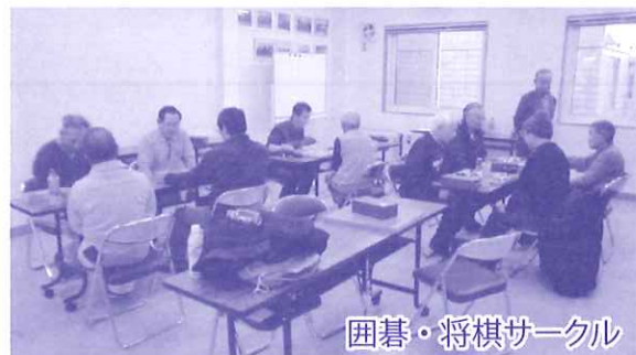
囲碁・将棋サークル