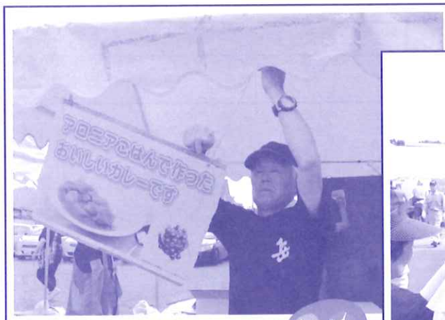
カレーブースの準備作業