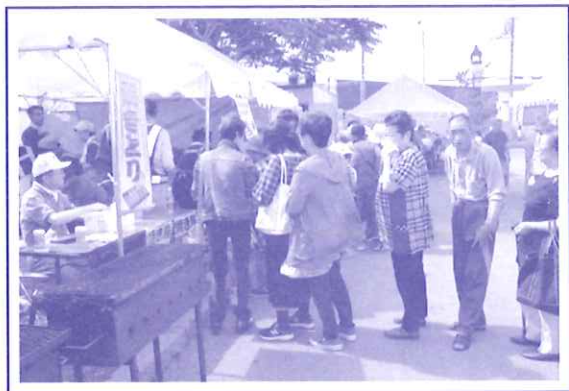
やきとりコーナー