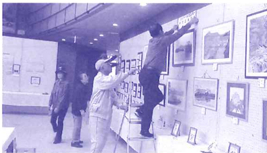
昨年の作品展準備の様子

発 行 伊達市シルバー人材センター 編 集 総 務 部 会(広報) 連絡先 ☎0142-23-6448 E-mail:datesc@dream.ocn.ne.jp