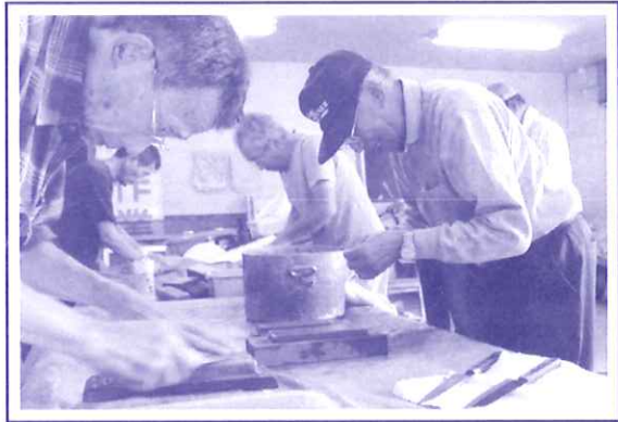
包丁とぎコーナー