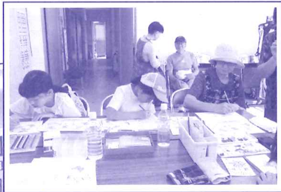
絵手紙コーナー・仲良く親子で!