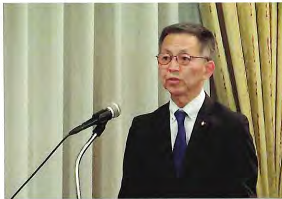
伊達市議会議長 辻浦 義浩