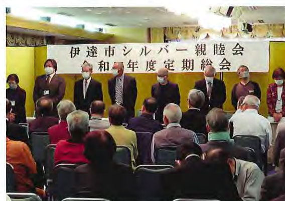
新役員のメンバー