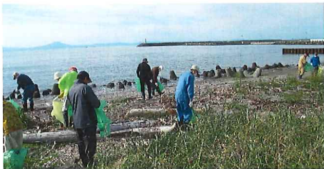
10月4日 東浜海岸清掃、サイクリングロード清掃 大滝バス停清掃がそれぞれ行われました。