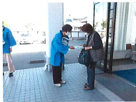
10月13日 市内の金融機関軒先をお借りして、 会員拡大啓発活動を行いました。