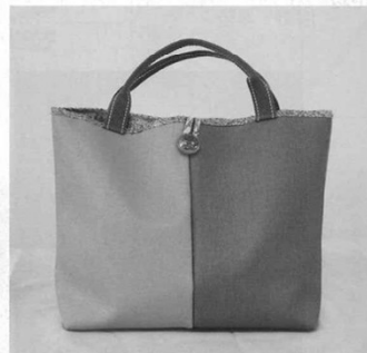
伊達市S C (北海道) 藤村キミ子 手芸品「手づくりトートバッグ」