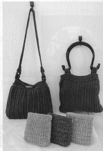
伊達市S C (北海道) 高家 祝子 手芸品「手編みバッグ・手編みポーチ」