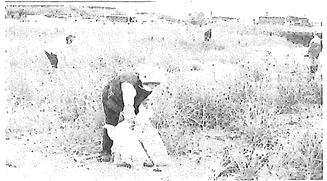
ごみを拾い集めるシルバー人材センター会員

7月4日（木）、第1回目のボランティア活動として、会員による「東浜海岸のごみ清掃」が行われ、その様子が7月6日付室蘭民報に掲載されたので紹介します。なお、第2回目は10月実施を予定しています。また、会員各位のご協力をお願いします。